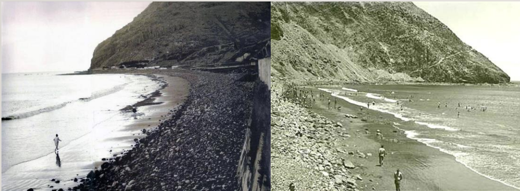
Las Teresitas antes de 1970