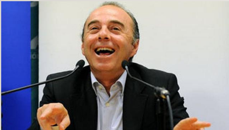
Miguel Zerolo, exalcalde de Santa Cruz de Tenerife.