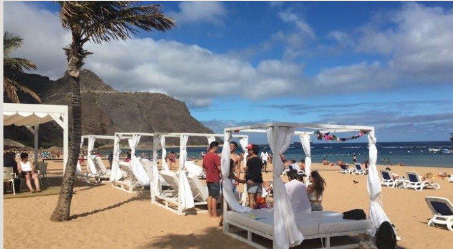
Las Teresitas en la actualidad