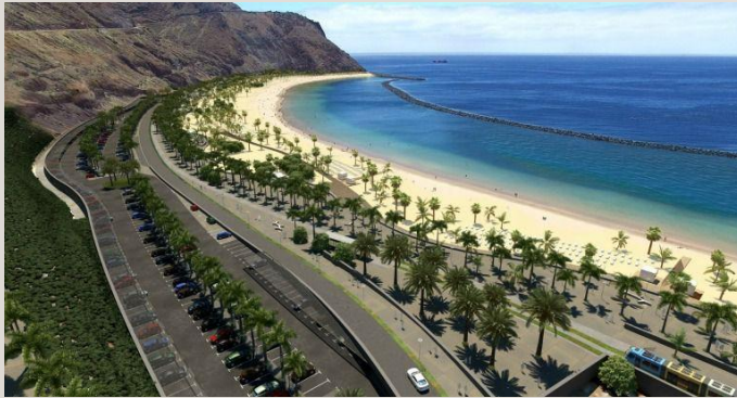
Cómo se esperaba que acabara la playa.